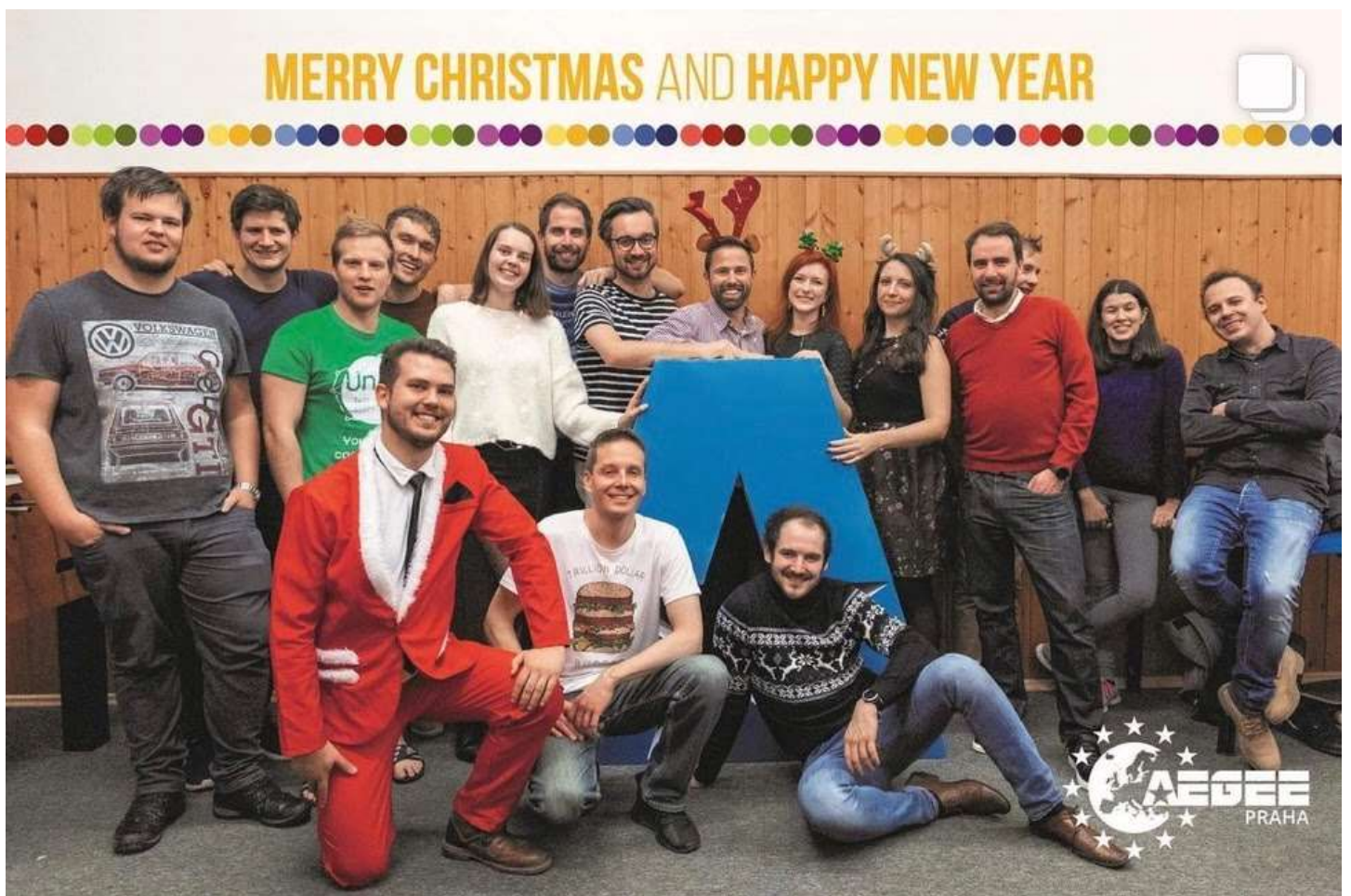
Vánoční večírek studentské organizace AEGEE Praha .